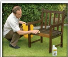
3. MIT WASSER ABWASCHEN