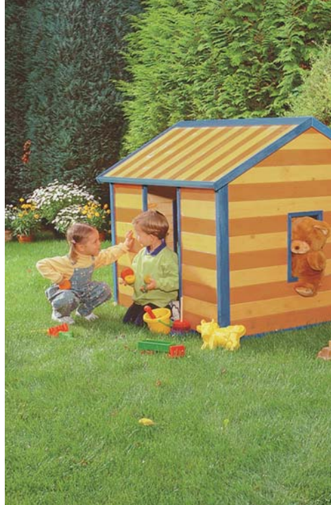
Spielhaus gestrichen mit Xyladecor Gartenholz-Lasur

Für Kinderspielzeug geeignet: geprüft nach DIN EN 71, Teil 3