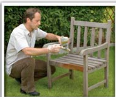
2. TEAKHOLZ-REINIGER AUFTRAGEN