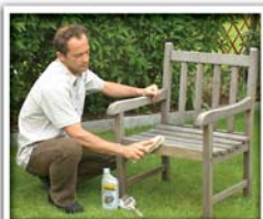
1. VERGRAUTES HOLZ ABBÜRSTEN

Ein moderner Garten lebt von klaren Linien und schlichten Formen. Durch den gezielten Einsatz ausgewählter Pflanzen und Materialien entsteht selbst auf kleinen Flächen wie Balkonen oder Terrassen ein eleganter Ruheplatz. Harthölzer wie Teak oder Bangkirai unterstreichen den gepflegten, schnörkellosen Gesamteindruck.