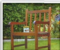
4. TEAK-MÖBELÖL AUF- TRAGEN – FERTIG

Aus alt wird neu! Sie haben auf der Terrasse oder dem Balkon noch ein paar vergraute Schätzchen? Kein Problem für das Teakholz-Programm von Xyladecor: Zuerst Teakholz-Reiniger auftragen, dann mit Teak-Möbelöl nachbehandeln, und Ihr Holz strahlt wieder wie neu. Übrigens: Teak-Möbelöl gibt's nicht nur im handlichen Kanister, sondern auch als praktisches Spray.